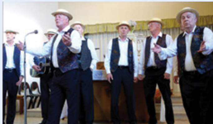
le Choeur Homme Vintage Barbershop de Castlebelligham (Irlande)