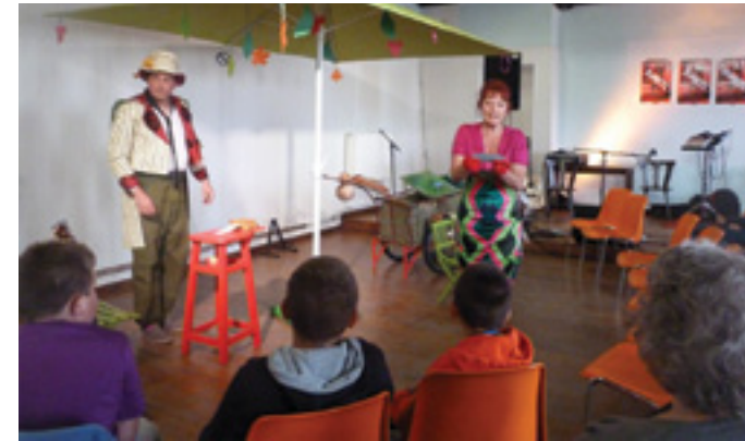
16h - Au jardin de l'école Marie Curie - Salle du Temple spectacle organisé par la Médiathèque...