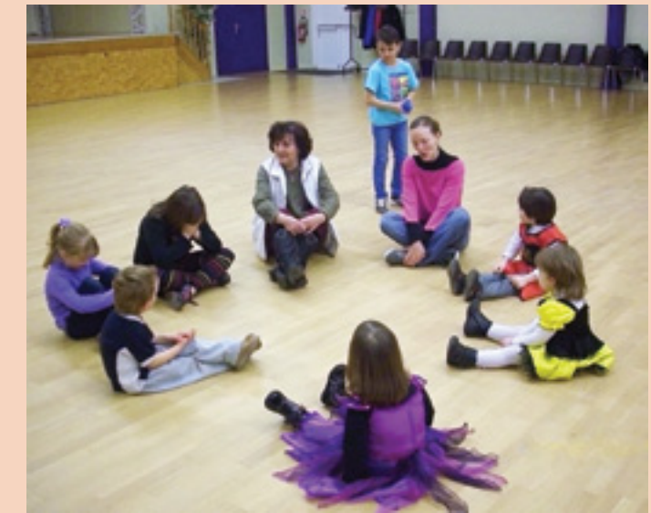
Une grande famille où petits et grands s'amuse