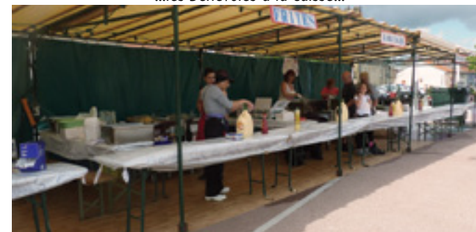
...et aux stands...