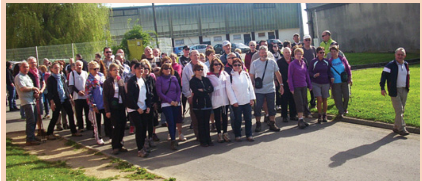
Marche du printemps, 10 mai Le départ est donné aux 60 marcheurs pour un parcours de 9 kilomètres