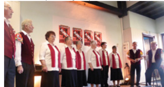
...le chœur mixte de l'ATSO...