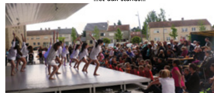
Début des spectacles place de l'Hôtel de ville espace «André WEILER» avec les p'tites Nanas