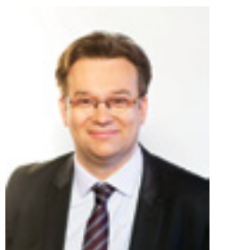
Le Maire Gilles DESTREMONT

A nous de retrouver les manches pour présenter des projets solides et sérieux. A quelques jours des congés d'été, je vous souhaite de bonnes vacances et de profiter de ces moments de repos bien mérités.