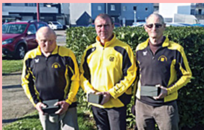
La tripléte gagnante