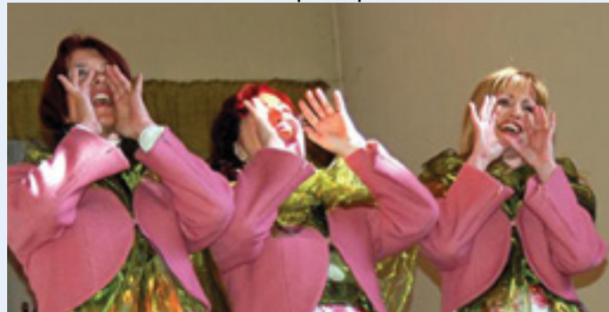
Le spectacle choral fut assuré par le Trio Vokal Kresnice de Nova Gorica (Slovénie),

4 ème édition du Festival MINES en CHOEURS du vendredi 24 au dimanche 26 avril 2015. Il fallait le faire ce 4 ème Festival, surtout après les coups d'assomoir qui l'ont précédé. En effet le lundi 21 avril nous étions informés que la chorale Sainte Marie de Yopougon Niangon d'Abidjan serait absente et, pour enfoncer le clou, le mercredi soir le chœur gospel Les Samuna de Brazzaville faisait de même. Nous étions tétanisés par ces deux nouvelles qui mettaient notre Festival en grand péril car il était trop tard pour penser à remplacer ces deux chorales. Mais tous les membres du Comité de l'Association, les choristes du chœur Homme Les Voix de l'Est, tous les bénévoles et les choristes slovènes et irlandais, avec un enthousiasme inouï, ont fait face à ces deux coups de poignards. Le Festival 2015 fut une réussite, à tous les niveaux ; le public répondit présent à Moutiers, à Aumetz et à Piennes, les messes du dimanche furent chantées par les chorales à Aumetz et Xivry Circourt, et le repas du samedi soir enchantait tous les participants.