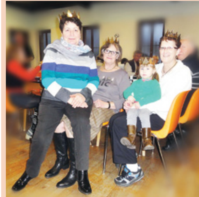
Galette des rois et surtout des reines pour bien démarrer l'année