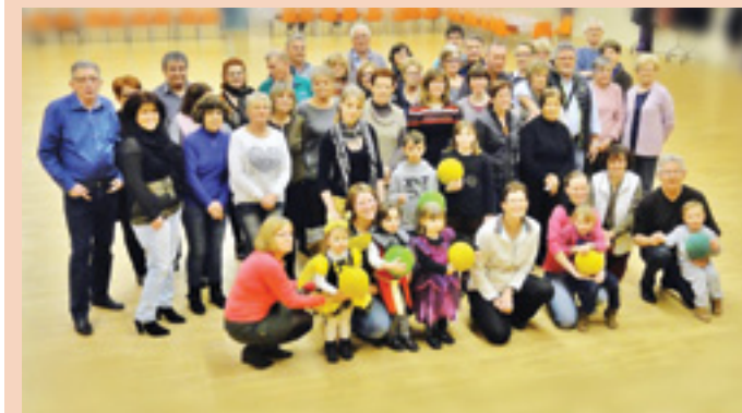
Soirée beignets ,