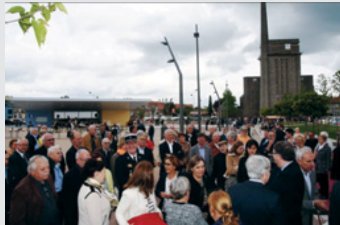
Présentation de la Charte réalisée par les élèves du Collège