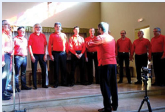
et le Choeur Homme d'Aumetz Les Voix de l'Est d'Aumetz