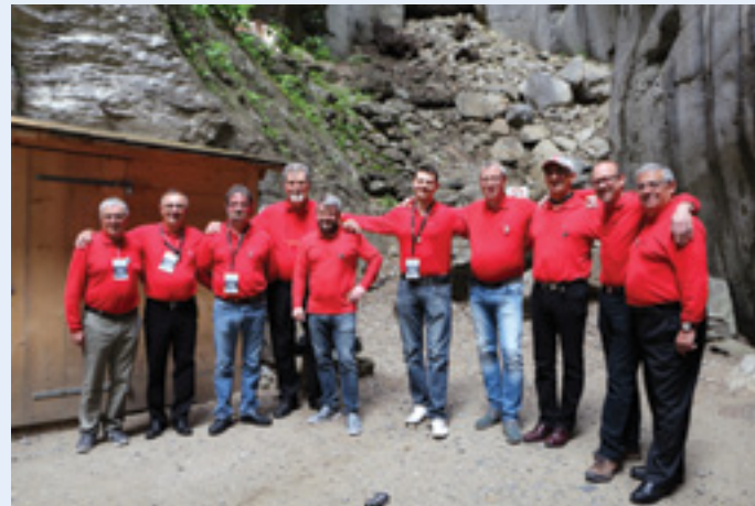
Les choristes du Choeur d'Hommes ont été acceptés pour participer à la Schweizer Gesangfest Meiringen -12/14 juin 2015 ( C'était le premier Choeur étranger à prendre part à cet évènement.....suivi du Còr Chairlinne de Carlingford - Irlande)

Ces trois chœurs rajoutèrent des chants aux programmes initialement prévus pour le grand plaisir du public. Nous avons conjuré le mauvais sort, 2015 fut une bonne cuvée, malgré ce manque d'exotisme qu'aurait dû apporter les deux chorales africaines. Pari gagné, et maintenant pensons déjà à l'avenir, à la prochaine édition 2016. Merci à toutes et à tous pour votre contribution : une fois encore nous avons prouvé qu'avec du cœur, de l'enthousiasme, beaucoup de travail et d'abnégation, beaucoup d'amitié, nous pouvions réaliser de très belles choses qui resteront gravées au fond de la mémoire de tous les participants de ce festival de chants de chorales Mines en Chœurs 2015.